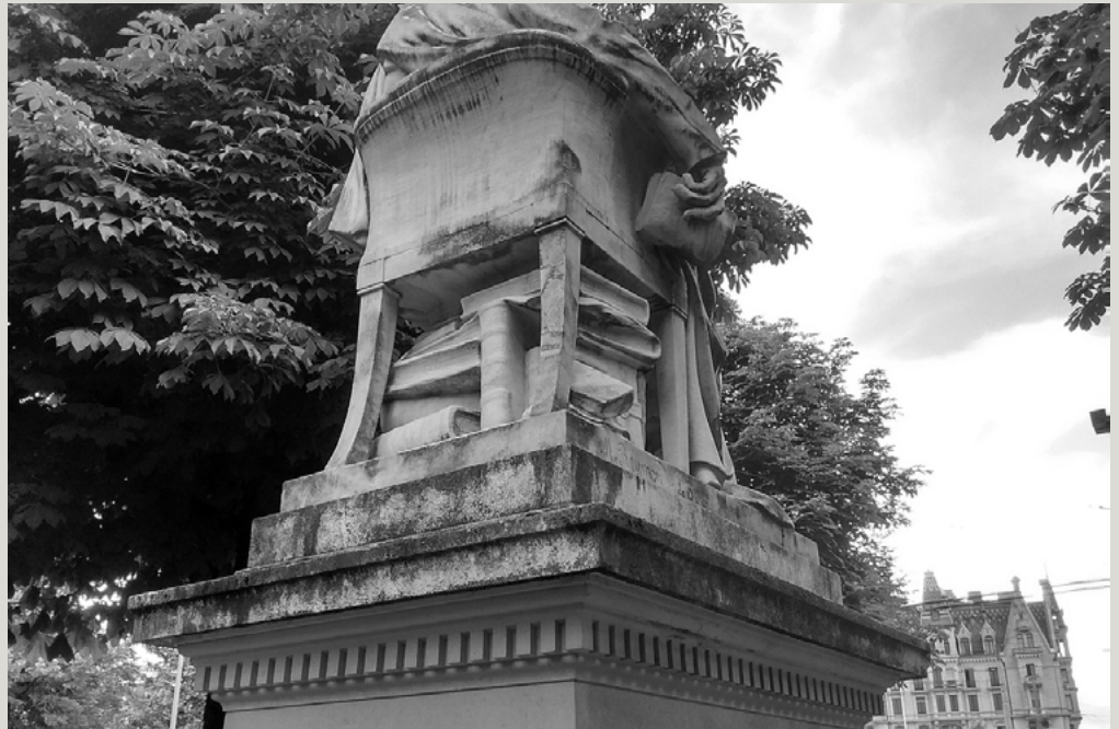
Sockel vom Denkmal für Reformist und Theologe Alexandre Vinet, 1900 errichtet